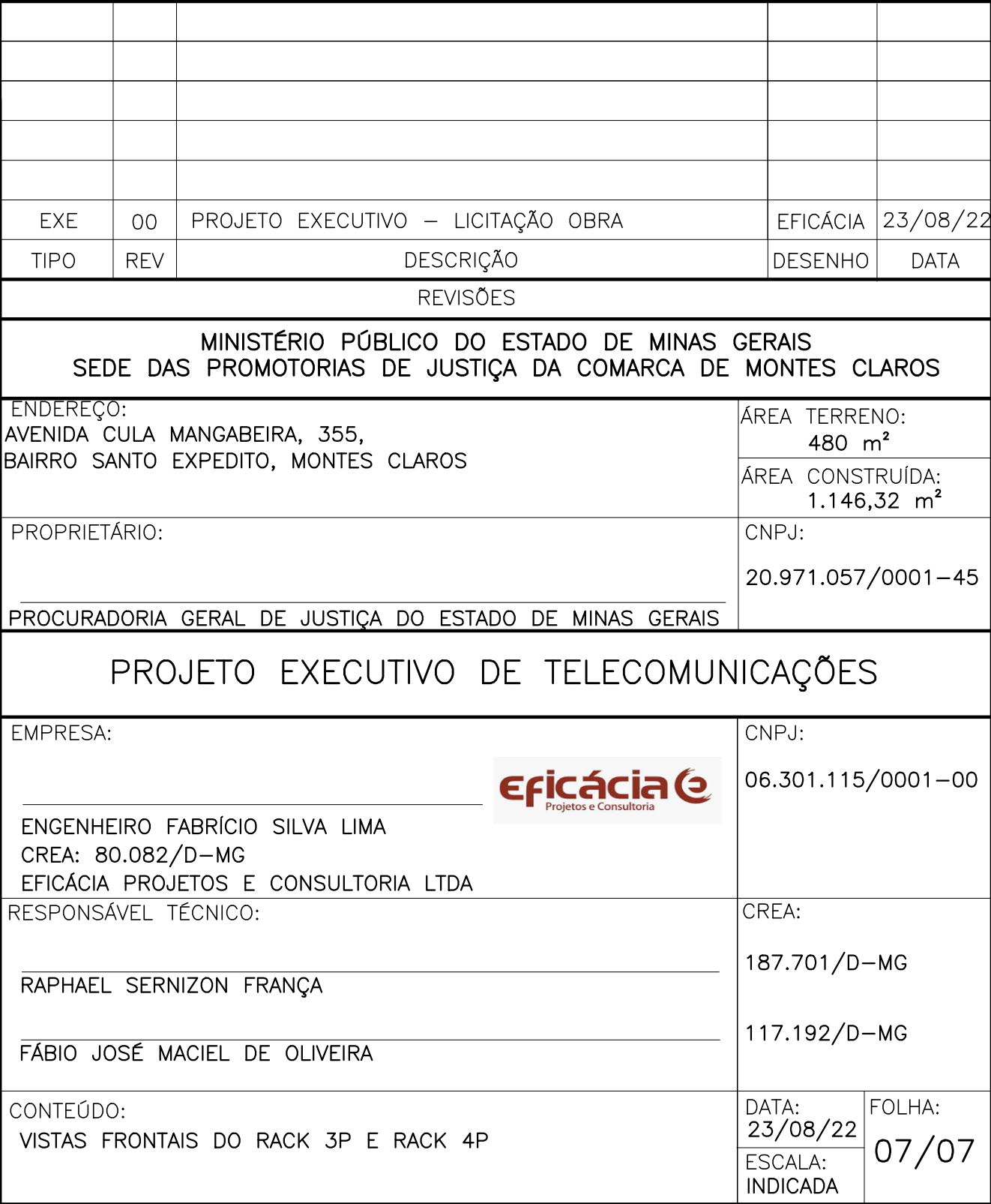
VISTA FRONTAL DO RACK 4P

NOTAS 01) IDENTIFICAR TODAS AS PORTAS DOS PATCH PANELS E VOICE PANELS 02) POSICIONAR O PERFIL FRONTAL NA DISTÂNCIA MÍNIMA DE 150mm DA PORTA DO RACK.