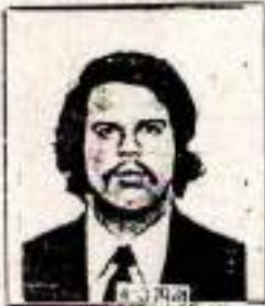
Fotografado em 04/03/74