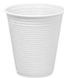
Copo Branco 400 ml