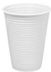
Copo Branco 300 ml