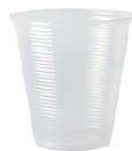
Copo Transparente 150 ml