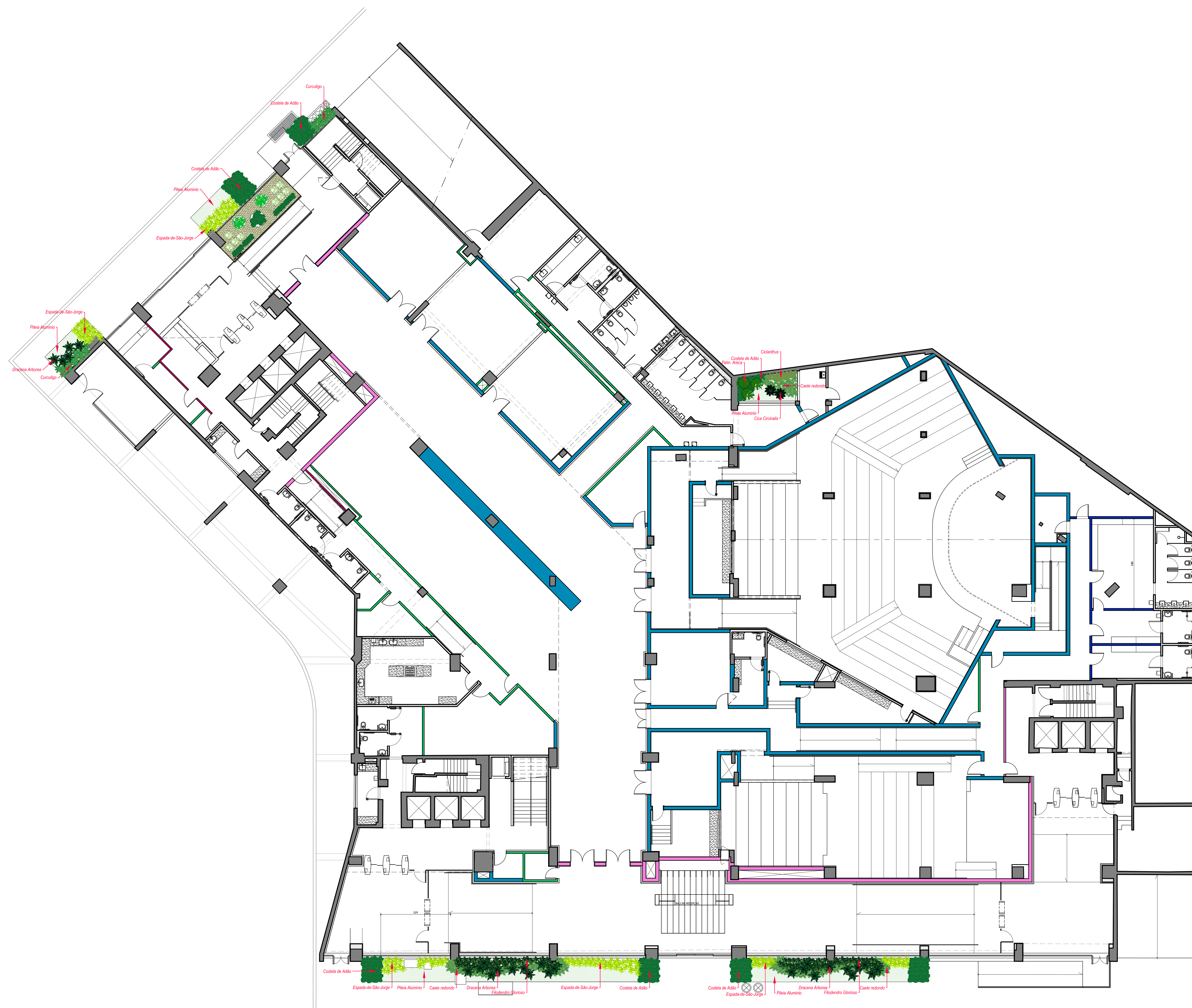
PLANTA BAIXA - PAISAGISMO Escala 1:125