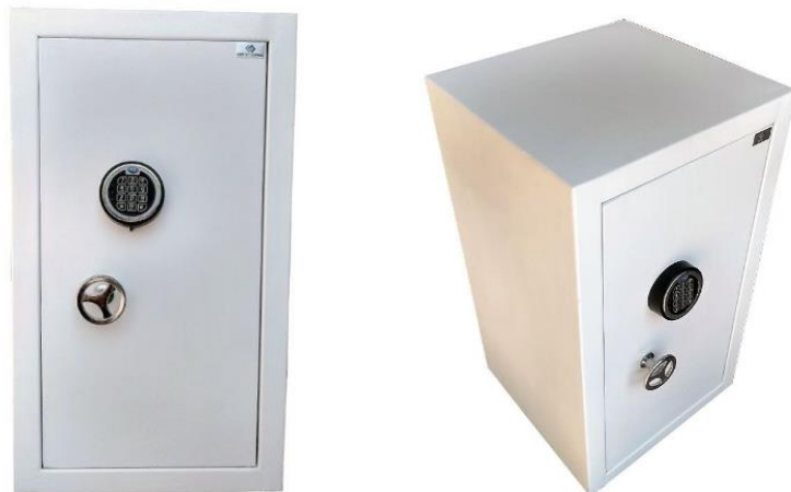
Fechadura Eletrônica Digital - GS03