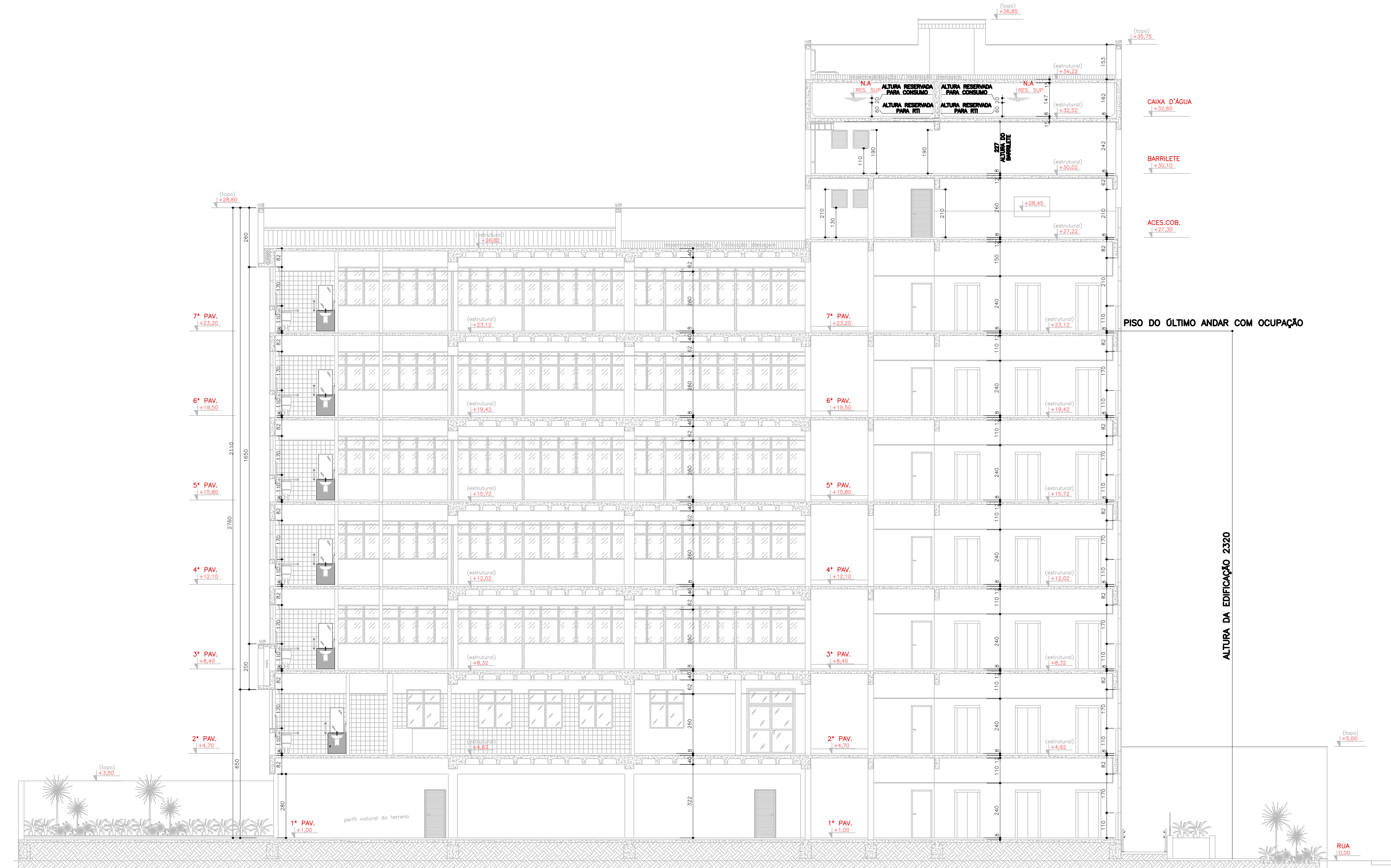
CORTE BB ESCALA 1/100