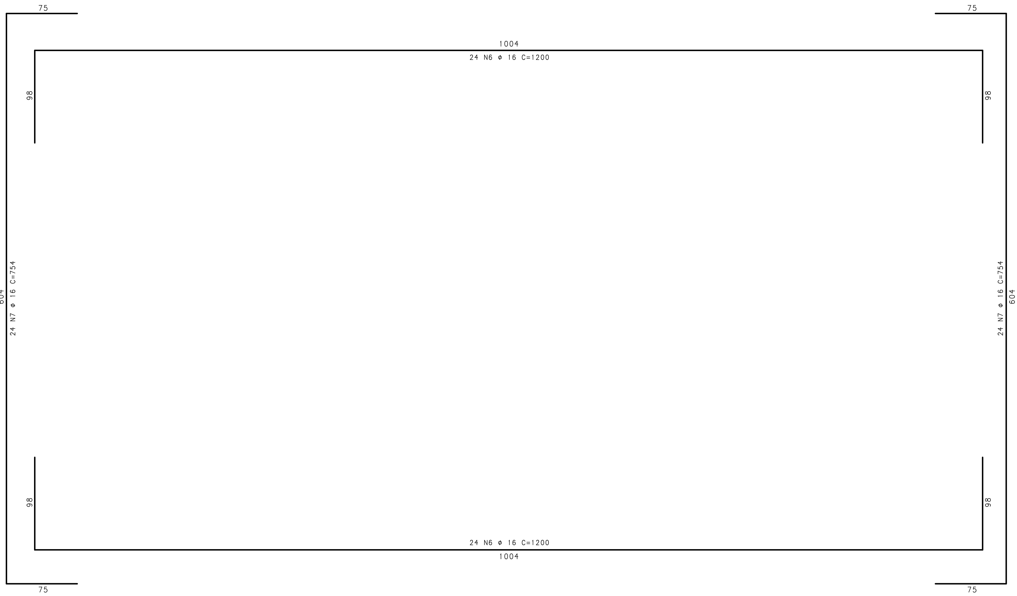
Corte B - B