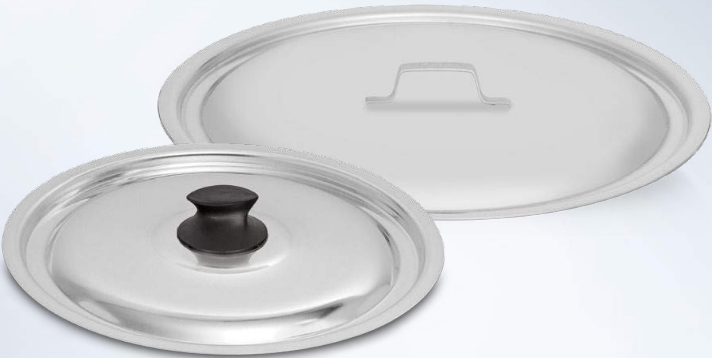
Tampa reforçada Aluminum lid | Tapa de alumínio