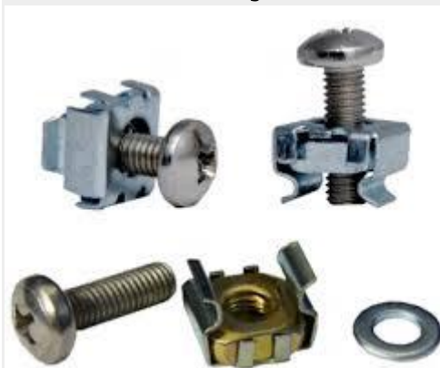
Foto ilustrativa Kit de Fixação