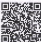
QRcode Confirma o Certificado