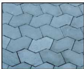
Modelo de assentamento

1º pav: calçada externa ao gradil, somente na entrada de veículos